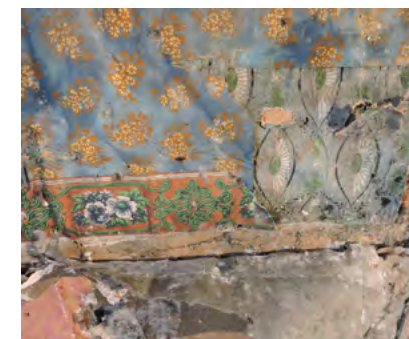
Figur 28: Håndtrykte tapeter fra ca. 1785 og 1805. Border i seks fargetrykk fra 1. etasje sør-øst.