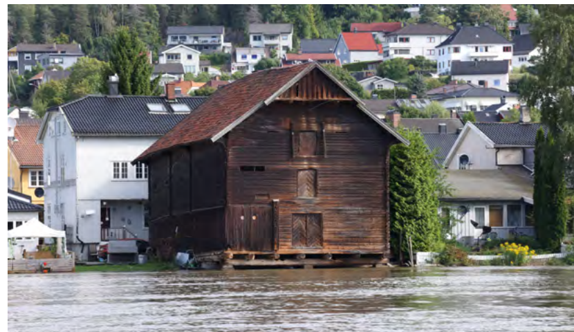
Figur 4: Drammensvassdraget etter uværet "Hans" i august 2023.

I kommuner der det ikke er en dedikert stilling til å arbeide med kulturminner og kulturmiljø, vil det være hensiktsmessig å utnevne en ansatt som kan ha regelmessig kontakt med kulturminneforvaltningen i fylkeskommunen. Det er ulik kompetanse på de ulike forvaltningsnivåene som kan virke