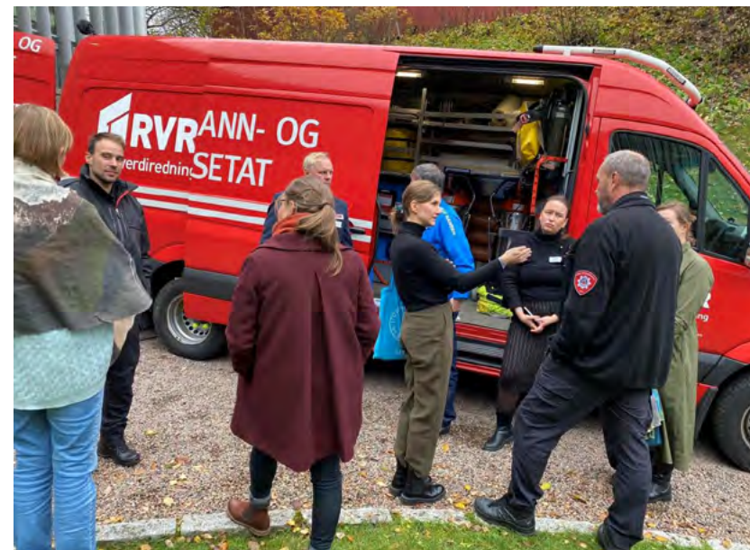
Figur 18: KKOAs er Kriseressurssamarbeid for kulturinstitusjoner i Oslo og Akershus (KKOAs). Fra KKOAs høstseminar 2023.

Du kan lese mer om KKOAs her: Nettsted for samlingsforvaltning (samlingsnett.no)