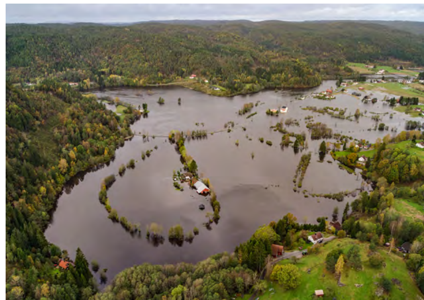
Figur 5: Drangsholt er et boligområde i Kristiansand kommune, som ble sterkt berørt under høstflommen i 2017. En engasjert velforening samarbeider nå med kommunen om varslings- og oppfølgingsberedskap i bygda. Les mer om dette i kapittel 9.

Du kan lese mer om samhandling og øvelser i kapittel 8.