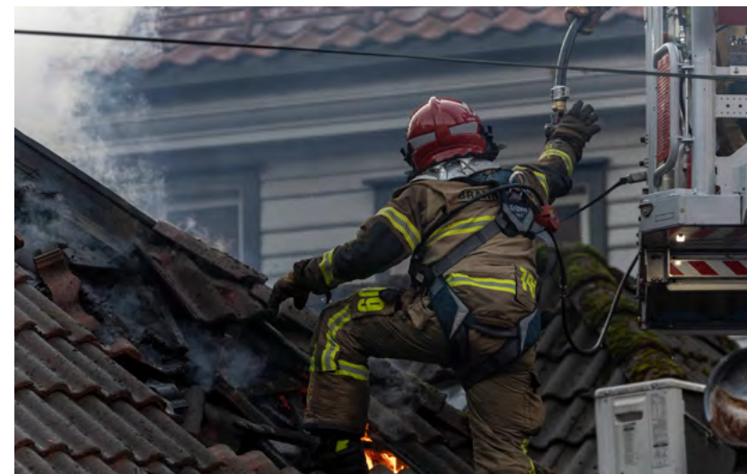
Figur 3: Slokkearbeidet i Bergen sentrum, oktober 2023.

Brannvesenet gis også anledning til å benytte tematilsyn der brannvesenet velger et tema for tilsynsaktiviteten basert på blant annet brannvesenets ROS-analyse. Bruk av lokale prioriteringer vil gjøre at man kan rette tilsynet mot områder man lokalt oppfatter som spesielt risikofylte.