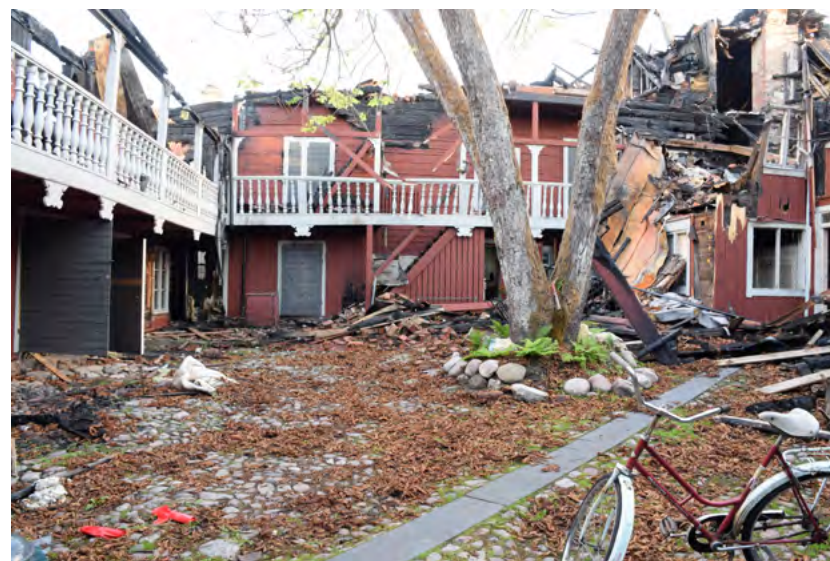
Figur 30: Gårdsrommet før rivingsarbeidene startet. For å beskytte stenleggingen ble det lagt markduk og et relativt tykt bærelag av grus.