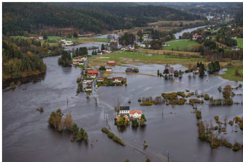
Figur 19: Drangsholt er et boligområde i Kristiansand kommune som blir sterkt berørt når Tovdalselva flommer over.

men, og lokalbefolkningen foretok egen nødvendig evakuering. En viktig lærdom fra episoden var at bygda ved velforeningen ønsket å samarbeide med kommunene om bl.a. en varslings- og oppfølgingsberedskap. Dette er formalisert i en samarbeidsavtale mellom velforeningen og Kristiansand kommune, og fem beboere i bygda vil bli varslet direkte fra kommunens beredskapssjef dersom oransje farevarsel med fare for rød og en storflomsituasjon oppstår.