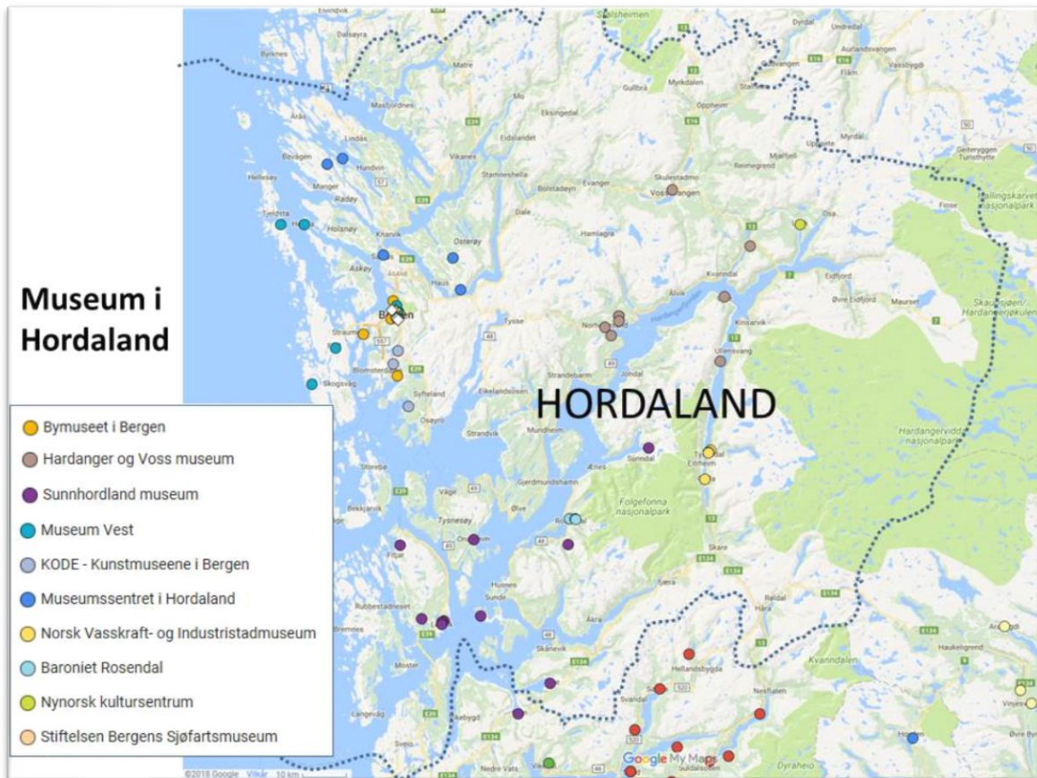
Figur 2. Kartet syner ei oversikt over museum i Hordaland som får statsstøtte via Kulturdepartementet. 6

Bygningsvernkonsulentane er eller har vore tilsette i dei konsoliderte musea i Hordaland: Sunnhordland Museum, Hardanger og Voss museum, Bymuseet i Bergen, Museumssenteret i Hordaland samt Museum Vest. Som kartet under syner, har musea fleire mindre einingar, og bygningsmassen som musea forvaltar, er ofte spreidd på fleire stader og i ulike kommunar. Det vert utover dette vise til Museumsloftet.