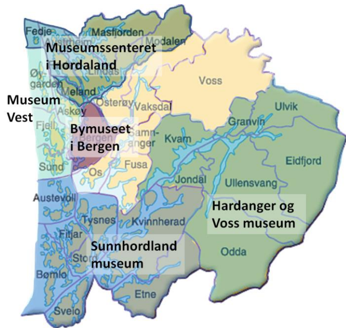
Figur 3. Oversikt over kommunar som fell under dei ulike musea.

Ved oppretting av bygningsvernkonsulentstillingane vart det søkt etter sivilarkitektar. Som tabellen nedanfor viser, er konsulentane tilsette i ulike stillingstypar og på ulik stad i dei respektive museumsorganisasjonane. Ved to av musea er konsulentane tilsette i leiarstillingar, medan dei to andre er fagtilsette. Ved dei fire musea som framleis har ordninga, er konsulentane fast tilsette.